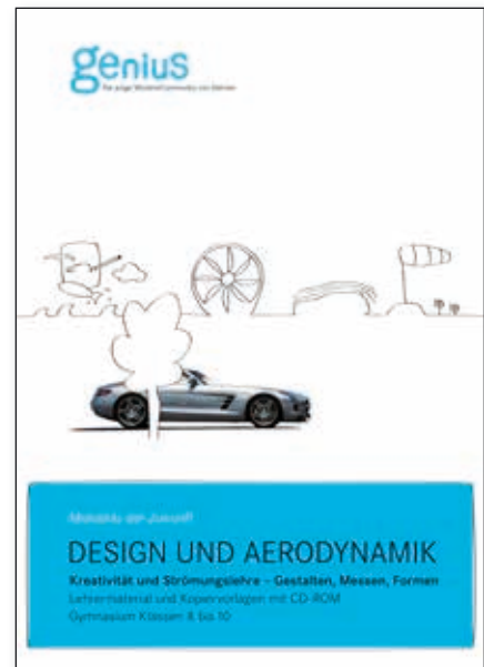
Titelblatt des Arbeitsheftes „Design und Aerodynamik“, herausgegeben von der Daimler AG.

gewisse Werbewirkung ausgeht“. 16 Jedoch, so das Ministerium, „sind sie in einem schulischen Gesamtkontext eingestellt, der dazu beiträgt, dass die Werbewirkung hinter dem schulischen Nutzen zurücktritt.“ 17