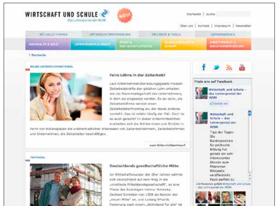
Screenshot wirtschaftundschule.de, Lehrerportal der INSM.