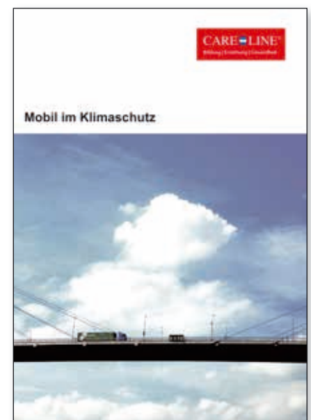
Titelblatt des Arbeitsheftes „Mobil im Klimaschutz“, herausgegeben von der Volkswagen AG.