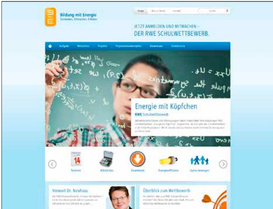
Einflussnahme mit Köpfchen? – Webseite des RWE Schulwettbewerbs

und Bekannte der Schüler. 34 RWE konnte sich so als fortschrittlich darstellen und erreichen, dass das Unternehmen mit Stromsparen und damit auch mit Klimaschutz in Verbindung gebracht wird. Auf politischer Ebene versucht RWE jedoch durch seine Lobbyarbeit häufig, Klimaschutzmaßnahmen zu verhindern. 35 Der Anteil an erneuerbaren Energien am Strommix von RWE betrug 2011 nach eigenen Angaben nur 8%. 36