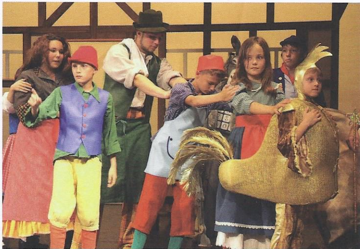
Der goldene Wetterhahn ist nicht nur goldig, sondern auch klebrig.